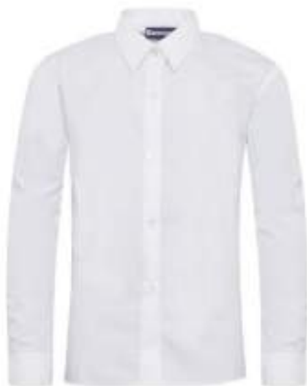
BANNER balta blūze garām piedurknēm, klasiska vai sašaurināta, (pakā 2 gab.) 65% poliesters 35% kokvilna. CENA: 23 eiro