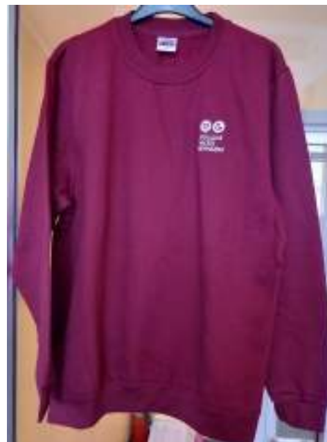
UNISEX sportiska stila džemperis (50% poliesters, 50% kokvilna), (bordo), CENA ar skolas logo: 22 eiro