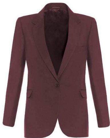
SIGNATURE žakete, 100% poliesters, mazgājama veļasmašīnā, mugurpusē viens šķelums. CENA AR SKOLAS LOGO: 56 eiro