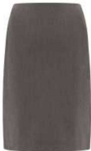
ASPIRE taisni svārki 65% poliesters 35% viskoze, trīs dažādi garumi, slēgts šķelums mugurpusē, pelēkā krāsā. CENA: € 25 (izmēriem ar vidukļa apk. 56cm - 71 cm), € 30 (izmēriem ar vidukļa apk.76 cm - 102cm)