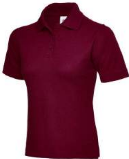
POLO KREKLS bordo, 50% kokvilna, 50% poliesters, izmēri XS-5XL, 220gsm CENA AR SKOLAS LOGO: 18 eiro