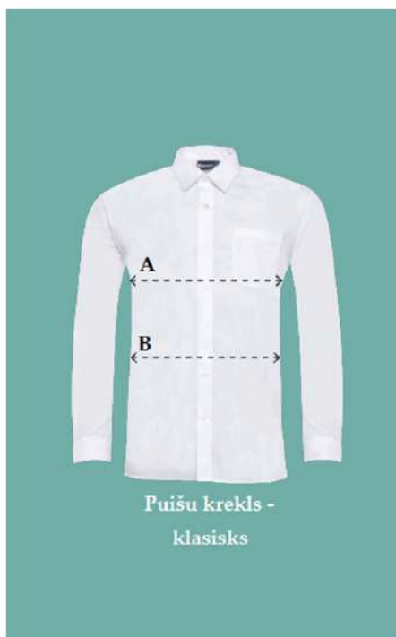
Puišu krekls - klasisks

*LŪDZAM ŅEMT VĒRĀ, KA DOTIE MĒRI IR APĢĒRBA – NE ĶERMEŅA.