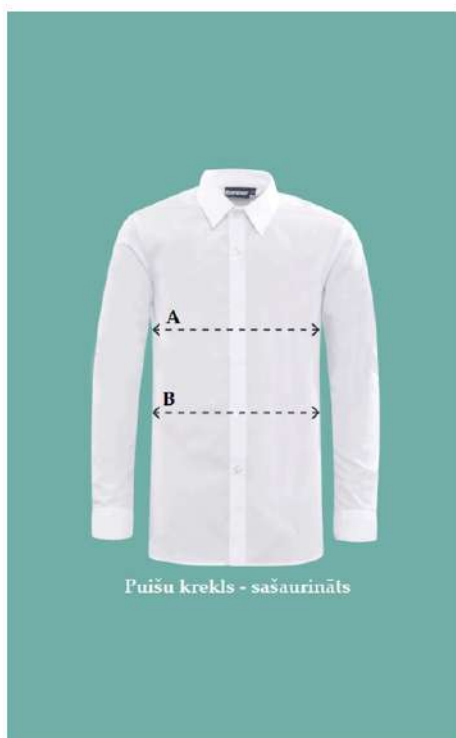
Puišu krekls - sašaurināts

*LŪDZAM ŅEMT VĒRĀ, KA DOTIE MĒRI IR APĢĒRBA – NE ĶERMEŅA.